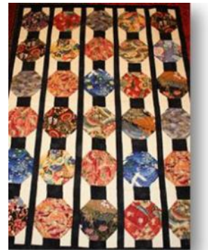
Se ofrecerá una hermosa colcha