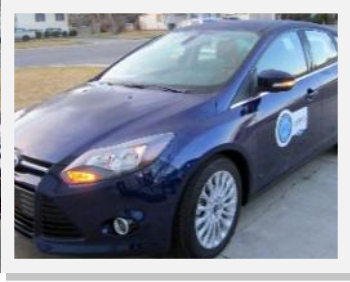
El Focus 2012 para conducir 10,000 millas por LWB

El programa de Nutrición y Asistencia al Orfanato quiere dar una pequeña actualización de nuestro reciente premio concedido por Ford Company y el Focus Global Test Drive Program . Tuve la maravillosa oportunidad de las actividades que han resultado en contribución financiera que será un regalo para los bebés en China.