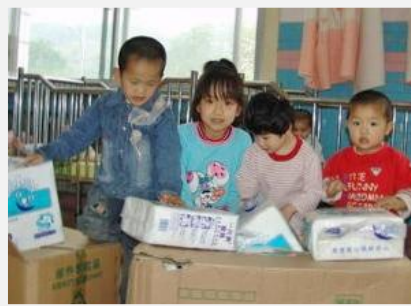
Abriendo nuevos suministros!

El Programa de Asistencia al Orfanato de Love Without Boundaries comenzó en 2003, cuando un grupo de padres adoptantes quisieron ayudar a dos orfanatos de China proporcionándoles leche infantil. Desde entonces, nuestro programa de nutrición se ha expandido a siete provincias y hemos proporcionado bienes y servicios a niños que viven en orfanatos por toda China. Con la ayuda de nuestros generosos donantes, hemos ayudado a orfanatos a adquirir lo necesario para proporcionar seguridad y confort a los niños, y también para enriquecer sus vidas. Asistencia al Orfanato ha ayudado a proveerlos de cunas seguras y